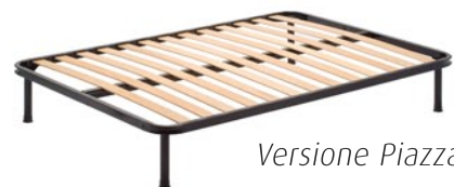
Versione Piazza e mezza